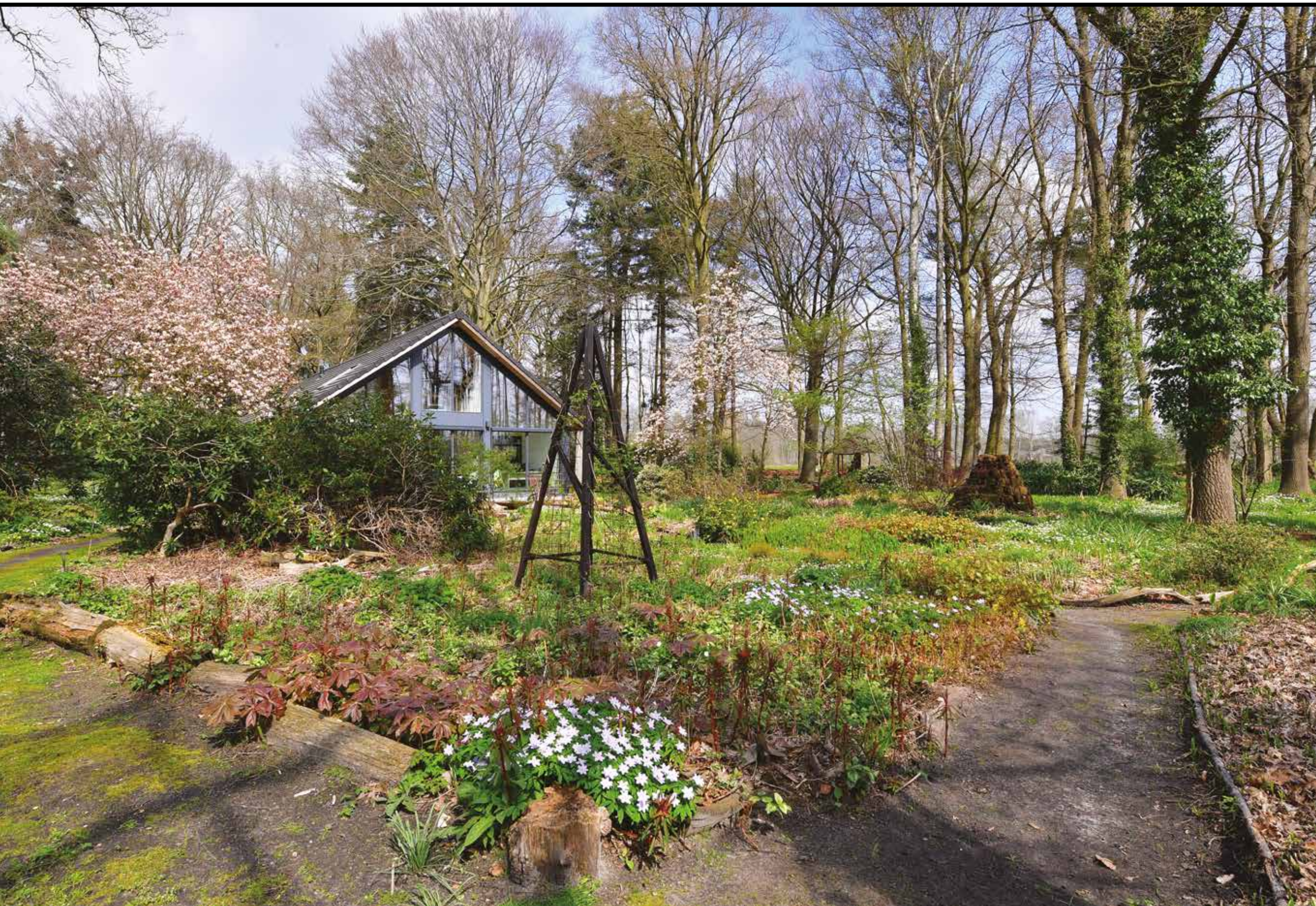
35 jaar geleden was dit nog een donker bos.